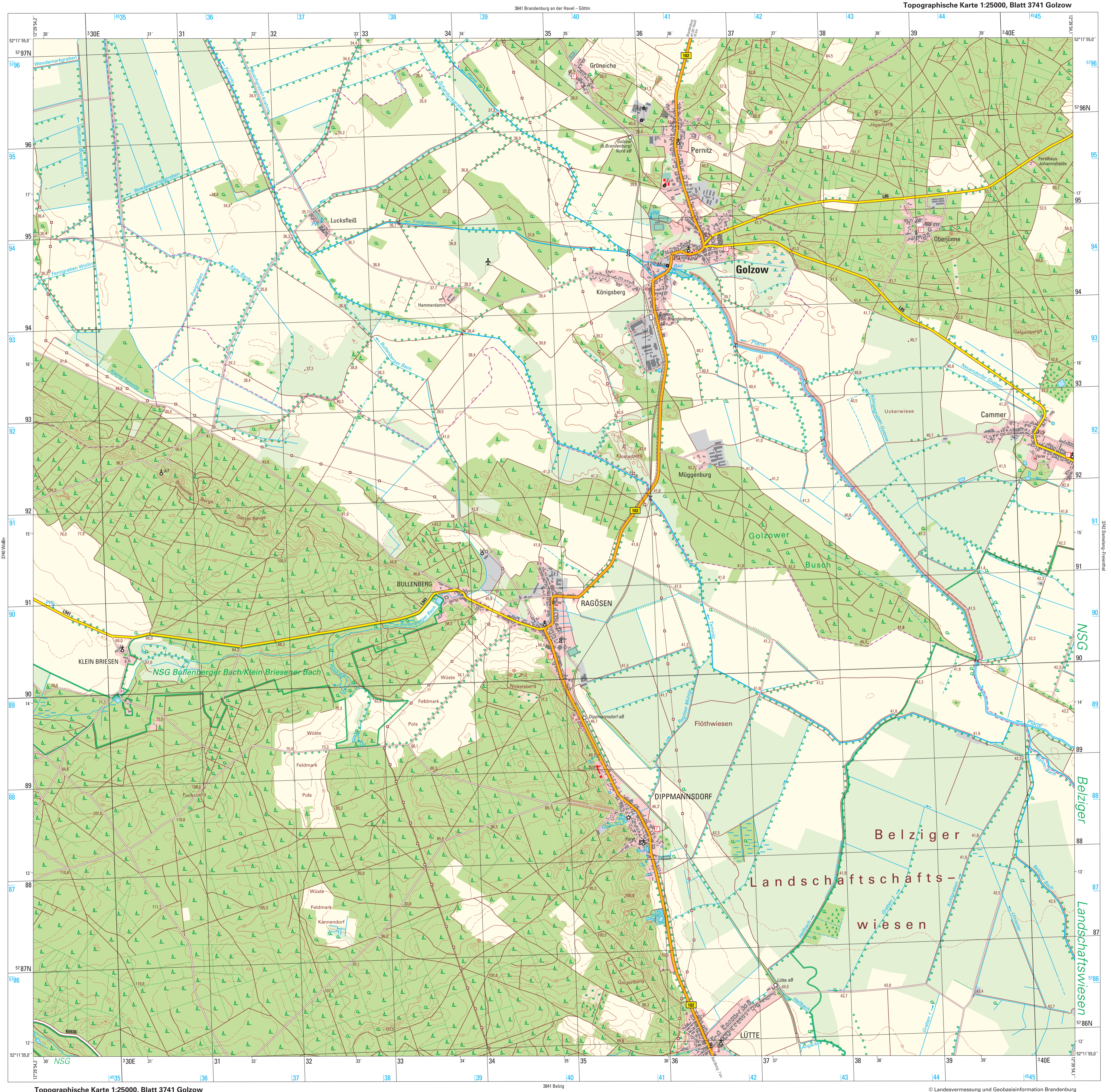
Topographische Karte 1:25000, Blatt 3741 Golzow