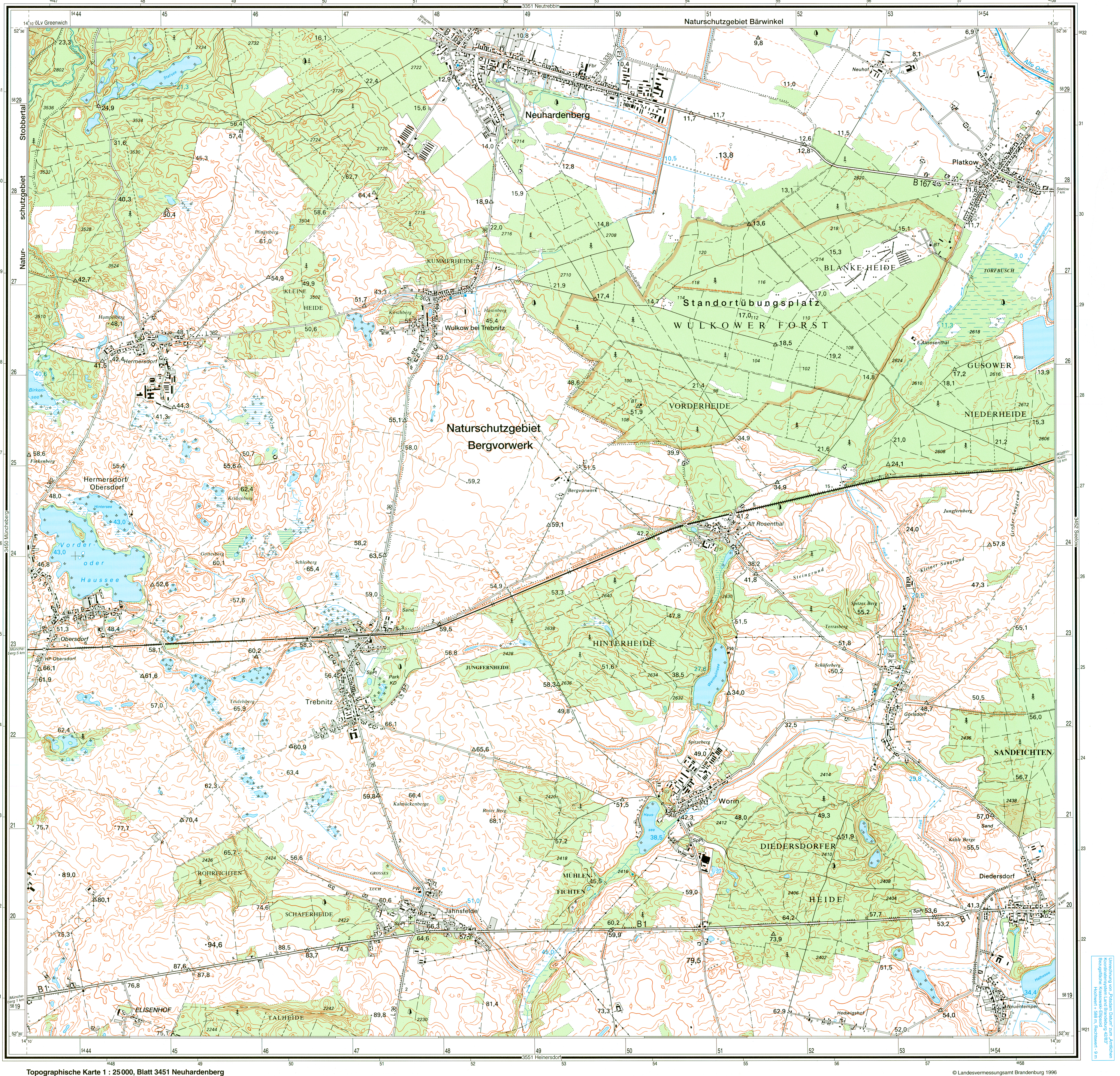
Topographische Karte 1 : 25 000, Blatt 3451 Neuhardenberg