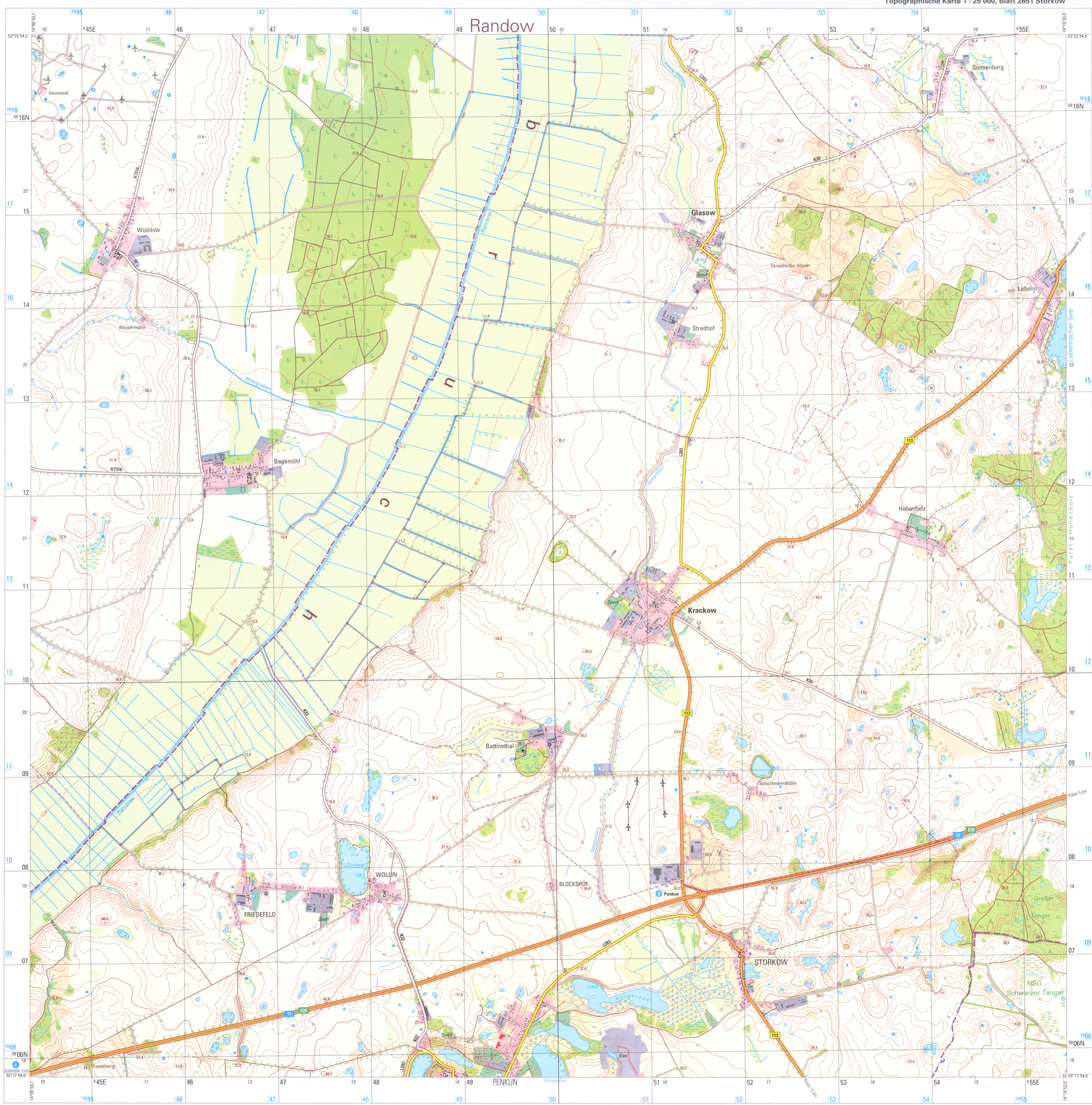
Topographische Karte 1 : 25 000, Blatt 2651 Storkow