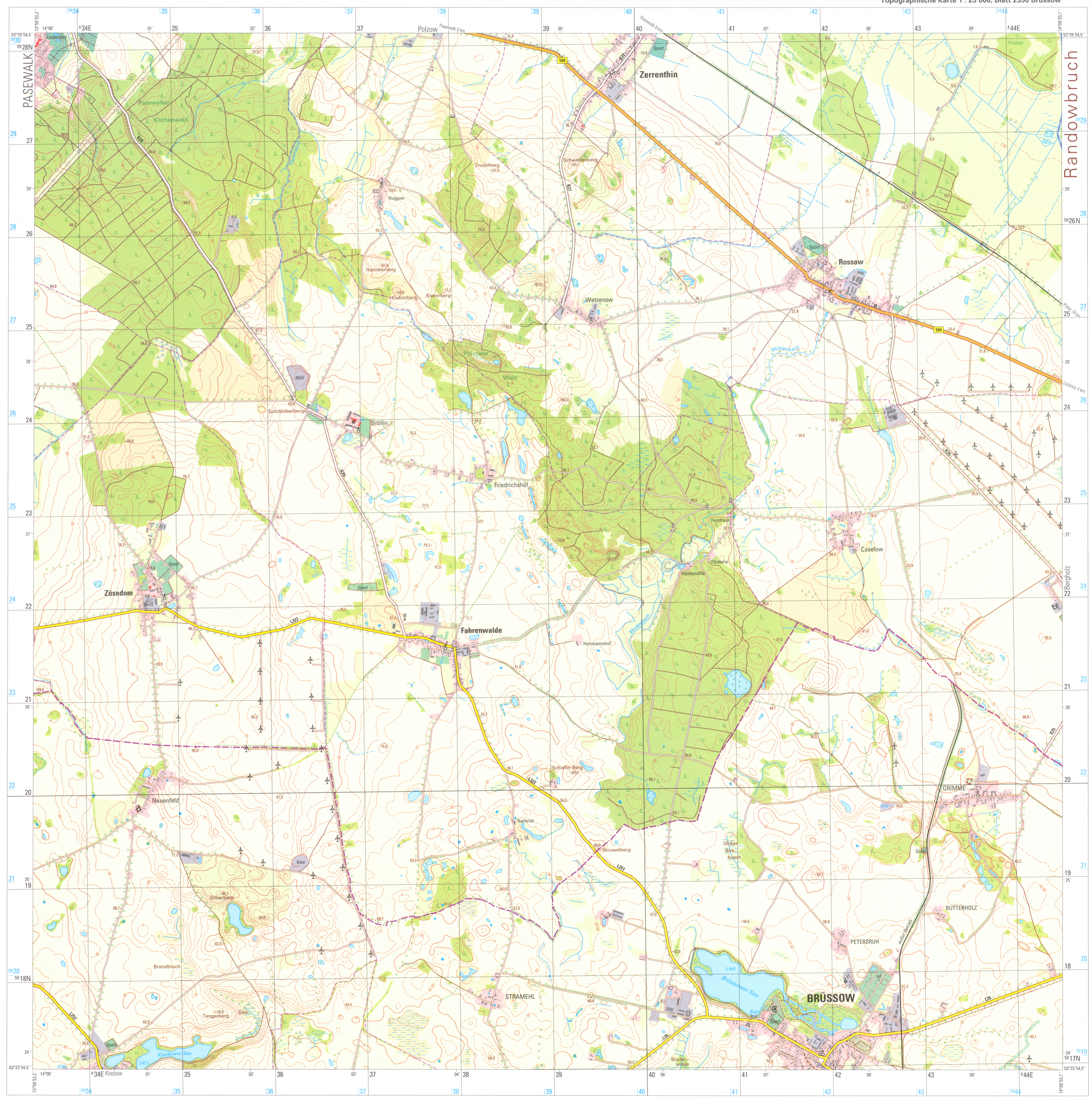
Topographische Karte 1 : 25 000, Blatt 2550 Brüssow

Maßstab 1 : 25 000 1cm der Karte entspricht 250 m der Natur